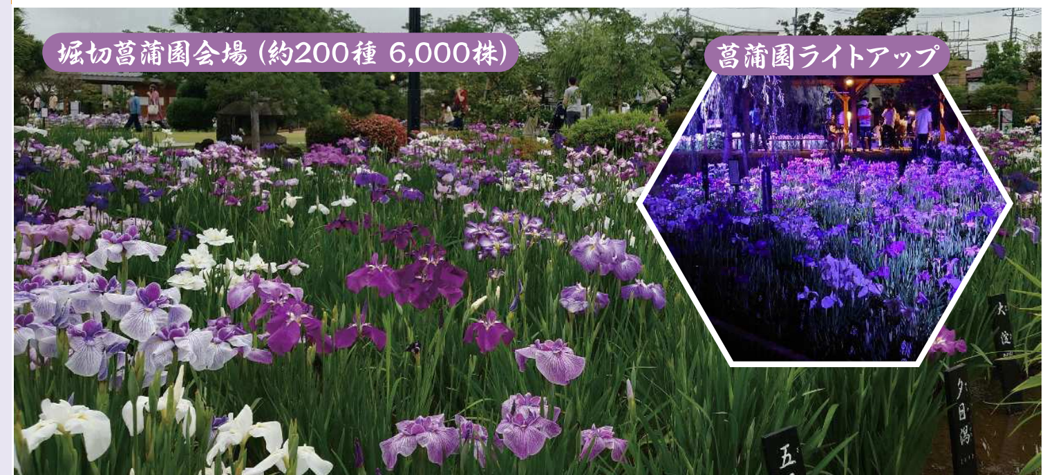
堀切菖蒲園会場(約200種 6,000株)