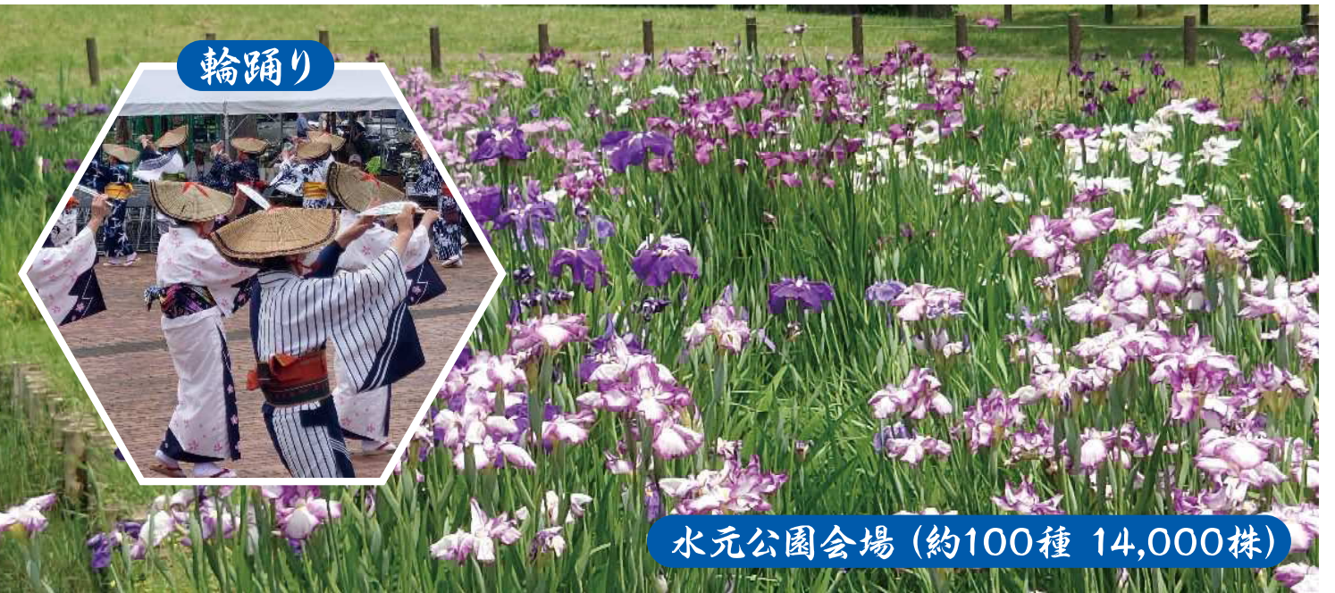
水元公園会場(約100種 14,000株)

※その他、ファミリーシャトル(水元公園循環バス)も運行しております。土日祝日のみ9:00～16:40まで20分間隔で運行